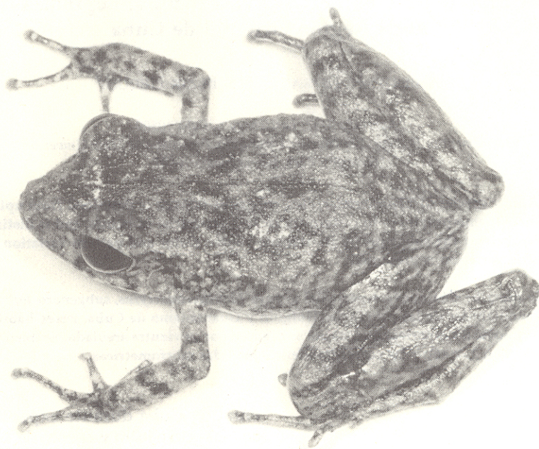
FIG. 1. Eleutherodactylus toa (4.9 km N La Municipión, Guantánamo, Cuba).